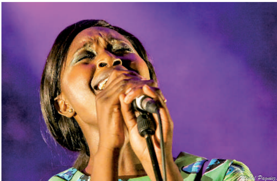
Exposition IBO Festival de photographie